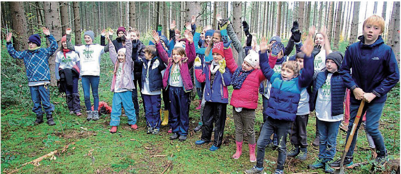
Wer die Welt retten will, muss anpacken: Die Kinder bei der Pflanzaktion am südlichen Ortsende von Martinsried.

Spenden gesammelt. Somit konnten 34 Kinder, die sich für diese Aktion angemeldet hatten, in einem Waldstück, das von Baron von Hirsch zur Verfügung gestellt wurde, 150 Bäume pflanzen. Den Kindern, die sich nun Klimabotschafter nennen dürfen, wurden auch Kenntnisse über den Klimawandel und dessen Folgen vermittelt. Text: Roman Bruggler