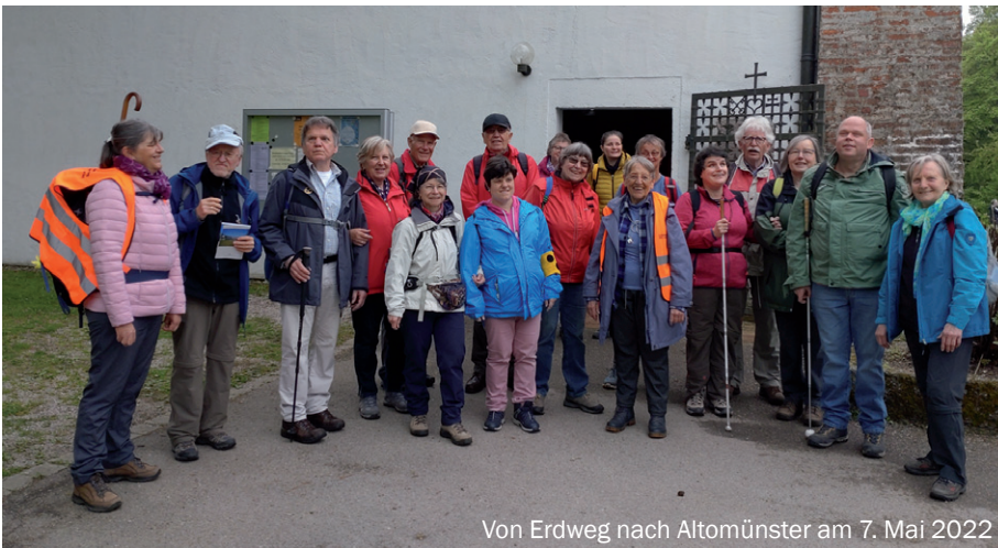
Von Erdweg nach Altomünster am 7. Mai 2022

im Vorstand ein Referat Inklusion einzurichten, und Veranstaltungen dazu jährlich, unabhängig von der Veranstaltungsreihe Inklusion im Würmtal, durchzuführen. Diese Inklusionsveranstaltungen, sei es Wandern, Klettern oder Bootfahren, werden von der Referatsleiterin An-