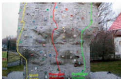
Einige Kletterrouten am Turm erinnern künftig an die Unterstützer bei der Realisierung des Vereinsheims: „Fichtl Kanter“, „Planegger Überhang“ und „Krailinger Variante“