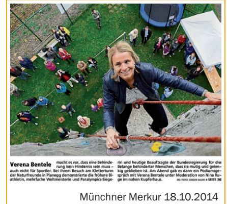
Verena Bentele macht es vor, dass eine Behinderung kein Hindernis sein muss – auch nicht für Sportler. Bei ihrem Besuch am Kletterturm der NaturFreunde in Planegg demonstrierte die frühere Biathletin, mehrfache Weltmeisterin und Paralympics-Siegerin und heutige Beauftragte der Bundesregierung für die Belange behinderter Menschen, dass sie mutig und gelangvoll geklettert ist. Am Abend geht es dann um Podiumsgespräch mit Verena Bentele unter Moderation von Nina Ruge im nahen Kupferhaus. • S. 118/19

derung schätzen die Atmosphäre an unserem Turm sehr, da es familiärer zugeht und nicht so laut ist, wie in den Kletterhallen. Durch die Inklusionswochen haben wir wichtige Kontakte, z.B. zur OBA (Offenen Behinderten Arbeit) und zum Blinden- und Sehbehindertenbund in Bayern, bekommen. Dies hat uns 2017 veranlasst,