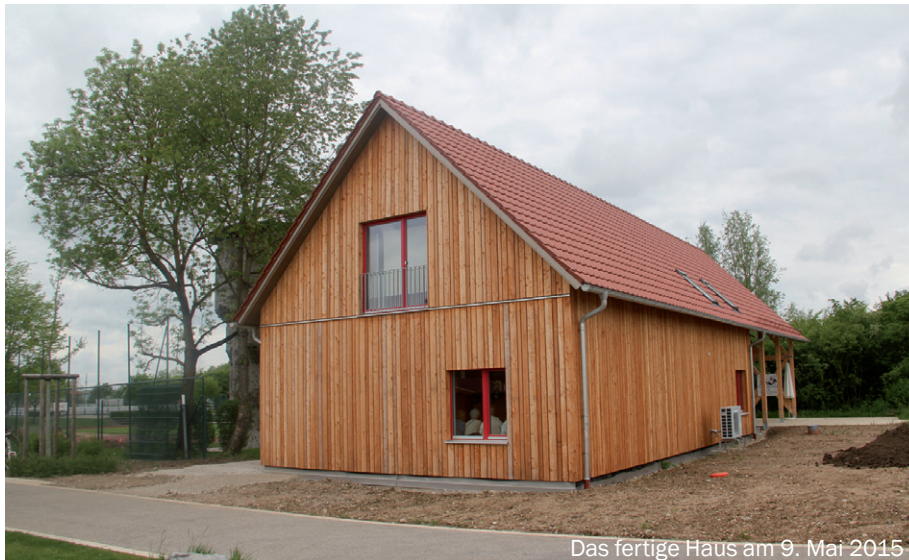
Das fertige Haus am 9. Mai 2015

Mittlerweile ist das NaturFreunde-Haus, wie gewünscht, zum Mittelpunkt des Ver-