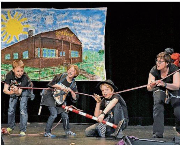
„Auf in die Natur, Freunde“: Beim bunten Abend im Kupferhaus testet der Vereinsnachwuchs auf der Bühne, wie sich Gummibärchen per Gummiband ins Publikum schießen lassen.