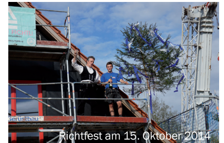
Richtfest am 15. Oktober 2014

So waren die ersten Jahre des letzten Jahrzehnts durch den Bau des NaturFreunde-Hauses geprägt.