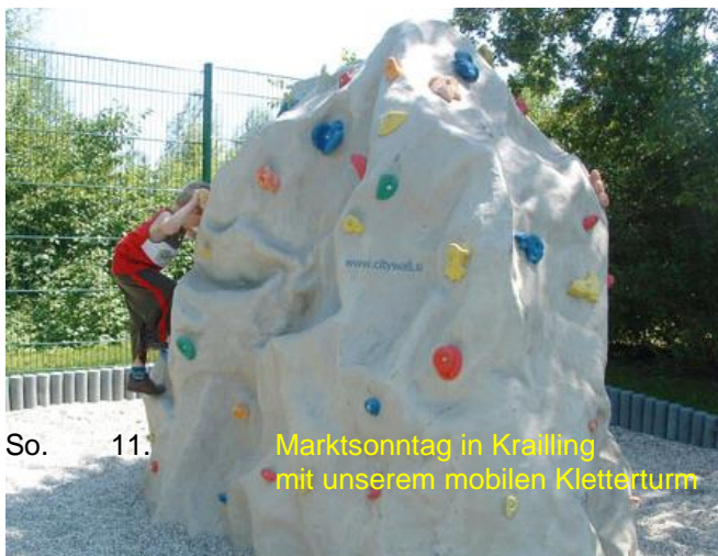
So. 11. Marktsontag in Kräilling mit unserem mobilen Kletterturm